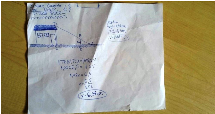
Слика 2. Мјерење куће

При избору садржаја треба водити рачуна да садржај буде занимљив, али и да мора бити повезан са оним што треба научити. Интересантан, али тривијалан и неважан материјал, може зауставити учење (Reppinger i sur. 1992). Тако, послје обрађене теме о пропорционалности дужина можемо од ученика тражити да сазнају висину своје куће, али да је не мјере, што се види са слике 2: