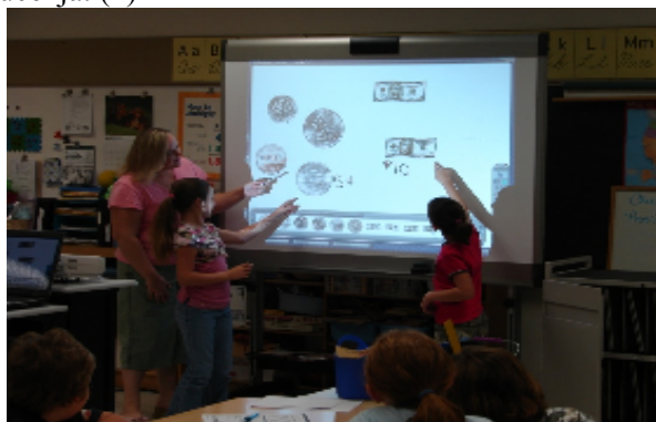
Slika 2. Aktivna elektronska tabla

tehnologija pruža mogućnost nastavniku da podiže kvalitet poučavanja i da obezbedi dvostranu komunikaciju u nastavi. Multimedijaska prezentacija doprinosi lakšem održavanju discipline u nastavi i kreiranju pedagoških situacije u kojima će se povećati misaona aktivnost učenika i dolaziti do izražaja njihova odgovornost za uspeh nastave i učenja. (4)