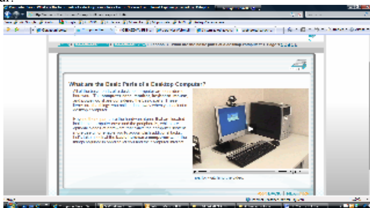
Slika 1. Softver za učenje informatike

očekuje se da će tastatura postati sekundarni uređaj a mikrofoni i elektronski uređaji primarni. Korišćenjem nove tehnologije obrazovanje postaje dostupnije širem krugu ljudi zainteresovanih za permanentno usavršavanje u svojoj delatnosti. Informaciona tehnologija u obrazovanju pruža mogućnosti za upotrebu novih nastavnih metoda i novu organizaciju nastave čime bi se nedostaci tradicionalne nastave mogli svesti u granice tolerancije. Klasične učionice i oblici rada se ne izbacuju nego se dodaje nova tehnologija koja integriše pozitivne elemente tradicionalne tehnologije menjajući položaj učenika i nastavnika u nameri da se poveća aktivno učešće učenika i stalno praćenje njegovog napredovanja. Korišćenjem multimedijalnih softvera moguće je pripremiti i realizovati nastavu u skladu sa individualnim sposobnostima i predznanjima učenika. Takođe, nastava postaje očiglednija, dinamičnija, povećava se unutrašnja i spoljašnja motivacija učenika, a znanja učenika postaju trajnija. Mogućnost dobijanja povratne informacije u realnom vremenu i kontinuirano vrednovanje znanja učenika omogućava kompleksniju evaluaciju svih aktivnosti učenika uključujući i činjenična znanja, razumevanje, sposobnost analize i sinteze znanja, primene znanja i dr.