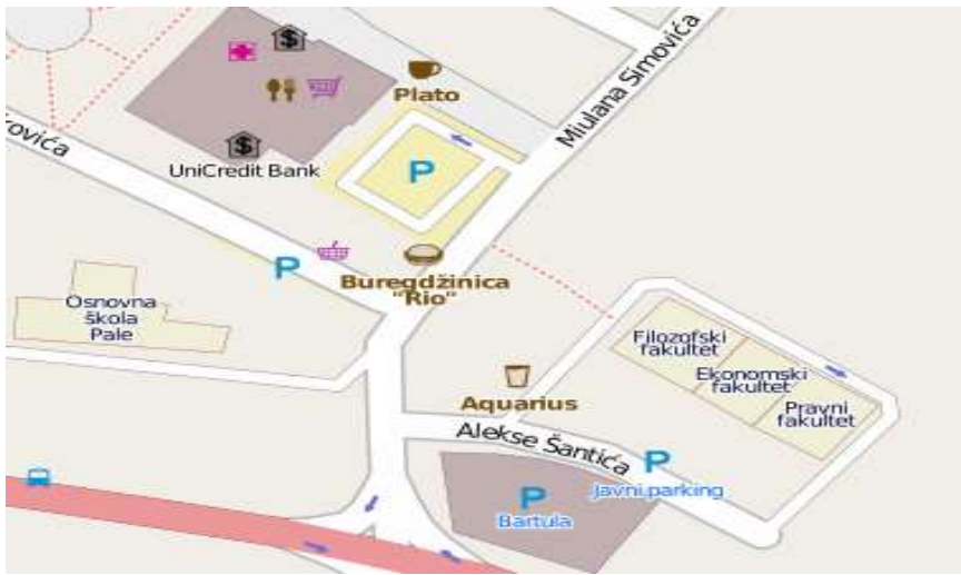
Слика 2 и 3. Примјери уноса просторних података: путна комуникација Лукавица – Пале и подручје око Универзитетског центра на Палама (подлога: базе мапе, дорадио аутор)